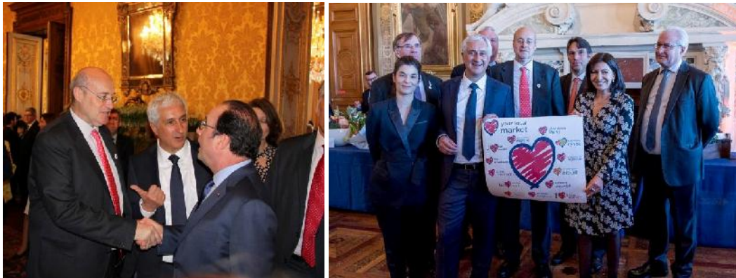
Bild links: WUWM-Präsident Manuel Estrada (links) mit Staatspräsident François Hollande (rechts). Bild rechts: Die WUWM-Vertreter mit der Pariser Bürgermeisterin Anne Hidalgo (2.v.r.)

Der offizielle Europa-Launch von „LYLM Love your local market“ fand am 1. Mai in Paris statt – mit einem feierlichen Empfang durch Staatspräsident François Hollande und die Bürgermeisterin von Paris Anne Hidalgo im Élysée-Palast.